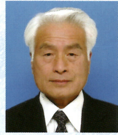
須賀川地区交通安全協会会長