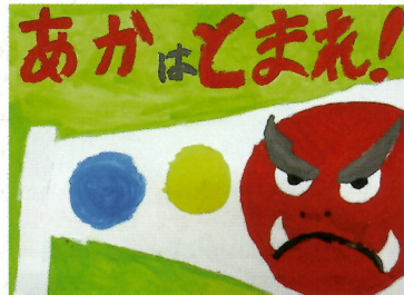
蕪木 怜衣 広戸小(1年)