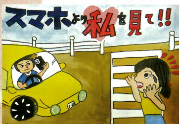
宗形 美星 須賀川一小(5年)