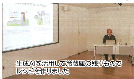
生成AIを活用して冷蔵庫の残りものでレシピを作りました