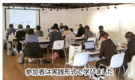
参加者は実践形式で学びました