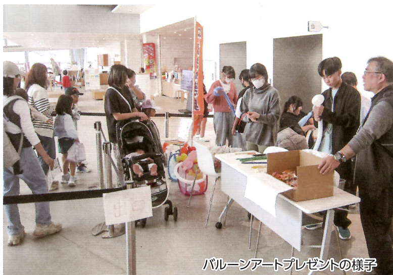
バルーンアートプレゼントの様子