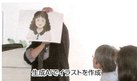
生成AIでイラストを作成

場 所 市民交流センターtette ルーム1-1 日 に ち 令和7年11月12日(水)