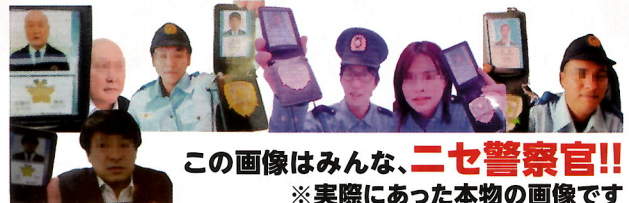
この画像はみんな、二七警察官!! ※実際にあった本物の画像です

警察がSNSで連絡することはありません! 警察からお金を要求されたら、それは詐欺! いますぐ相談を!