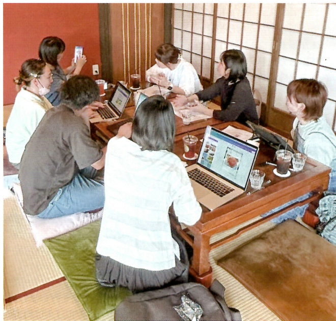
キャンパって作るっ会 デザイン講座による小商い同士のスキルアップと交流