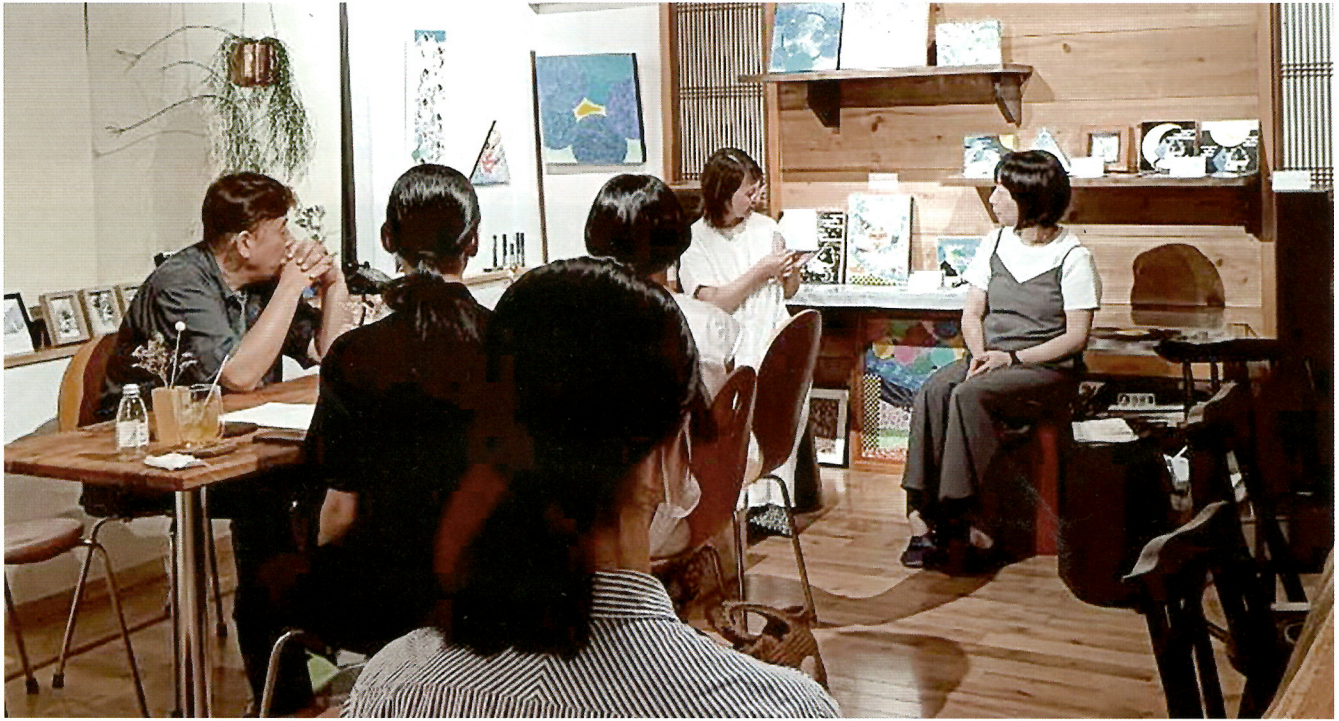
本と喫茶の会 朗読と本を通じた交流

参加者みんなが学び合いを通じて成長し、交流して地域のみんなが笑い合える明るいミライを作ることを目的に活動しています。