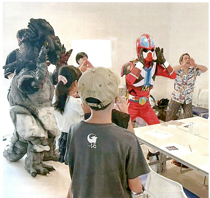
ふくしま特撮LOVE会 親子向け防災講座